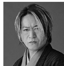
京極 夏彦さん 小説家