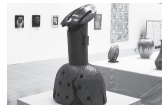
第33回亀岡市美術展賞受賞作品